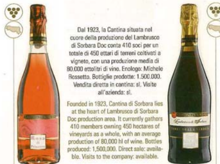
Rosa di Primavera Lambrusco di Modena Doc 2010

Via Ravarino - Carpi, 116 - 41030 Sorbara di Bomporto (MO) - Tel. 059.909103 Fax 059.818524 - www.cantinasorbara.it - info@cantinasorbara.it